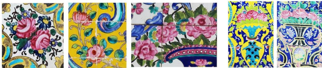
تصویر ۷ دو تصویر سمت راست: گلدان در کاشی های محوطه کاخ گلستان (نگارندگان، ۱۴۰۳).

نقش گل رز که در گستره رنگی سرخ تا صورتی و در اندازه های گوناگون هم در قالی و هم در کاشی ها دیده می شود، از نقش مایه های مشترک میان نمونه های مورد بررسی است که با ساختاری واقع گرایانه اجرا شده است. نقش گل رز از مشهورترین عناصر طبیعت پردازانه وارداتی از اروپاست که با توجه به فضای کلی طرح، مضامینی را نیز در بر می گیرد. نکته قابل توجه در این نقش مایه، تفاوت مفهوم آن در اثر دست باف و در کاشی کاری است؛ نقش مایه گل رز در قالی، در فضایی مانند باغ رسم شده و اگر از آن تعبیری معنوی صورت گیرد و آن فضا را به بهشت مانند کنند؛ می توان برداشتی غیر مادی از گل ها داشت و معنایی فرازمینی برای کل ترکیب نیز قائل شد. اما همان نقوش گل در کاشی ها، با توجه به کلیت طرحی که در آن قرار گرفته و رسم شده اند؛ صرفاً می توانند خوانشی مادی داشته باشند. گل ها نقش تاثیرگذاری در کلیت طرح دست بافته و نقاشی سطح کاشی ها داشته است، به نحوی که با توجه به ویژگی های بصری گل های رز، در کنار آنها از سایر نقوش یادآور فضای طبیعت، استفاده شده است. این گل های رز که از لحاظ ساختار و فرم اجرایی، نقوشی جدید در هنر قاجار بشمار می آیند؛ در کنار انواع گل های دیگر، گلدان ها در شکل های متنوع در کنار پرندگان، فرم ها و ساقه های اسلیمی، هم در قالی و هم در کاشی ها به چشم می خوردند (تصویر ۷).