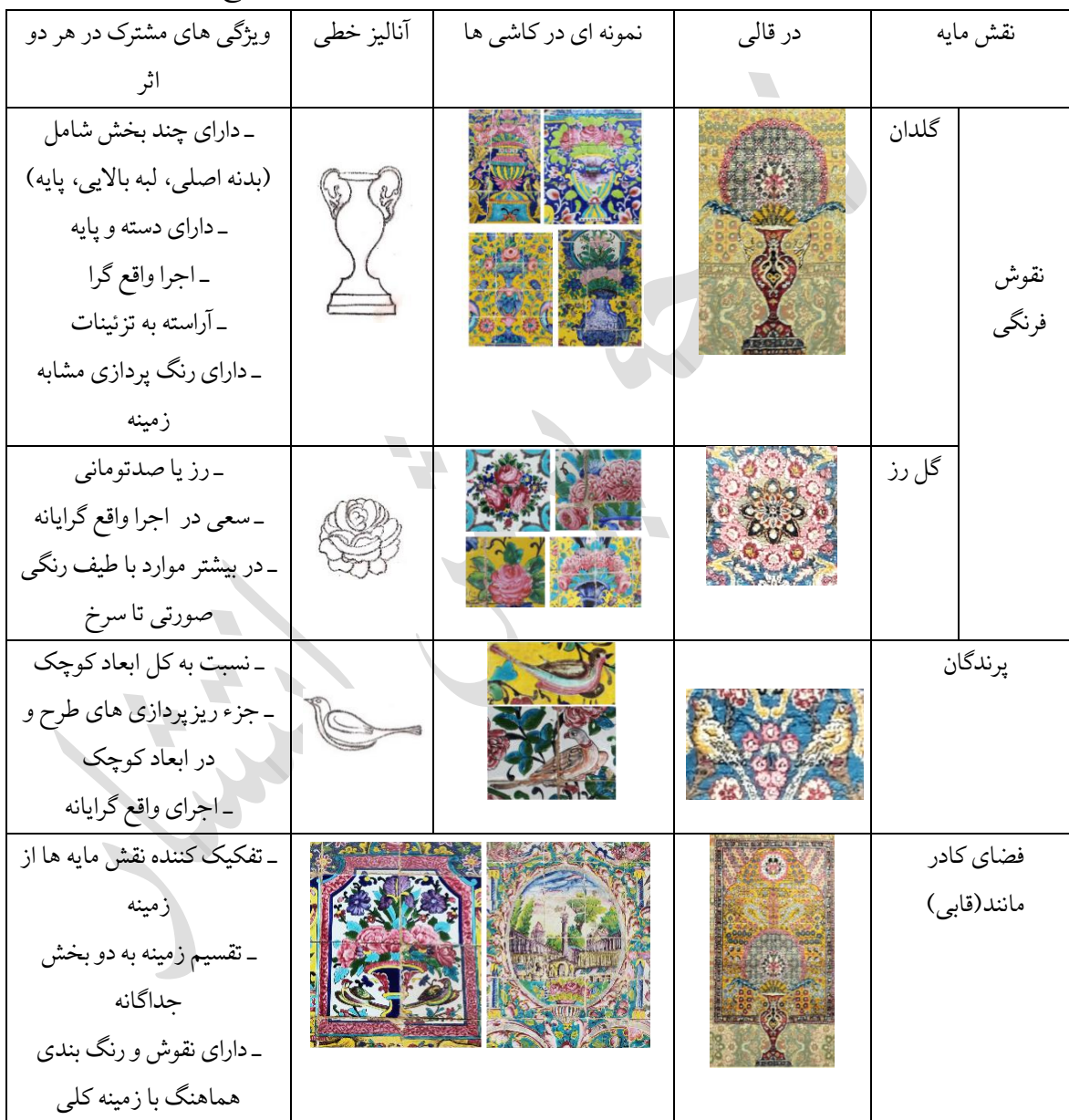
جدول ۱. بررسی ویژگی ها و همانندی در ساختار نقش مایه های قالی تهران و کاشی های محوطه کاخ گلستان

دهد. بنابر توضیحات بیان شده، استفاده از نقوش با ساختاری واقع نما در ترکیبی طبیعت پردازانه، هم در قالی و هم در کاشی کاری های کاخ، واضح بوده و بررسی همانندی نقوش قالی با توجه به تاریخ بافت آن، نشانگر تاثیرپذیری آن، از تزئینات و نقوش کاشی های قاجاری و به طور خاص، کاشی کاری محوطه کاخ گلستان است (جدول شماره ۱).