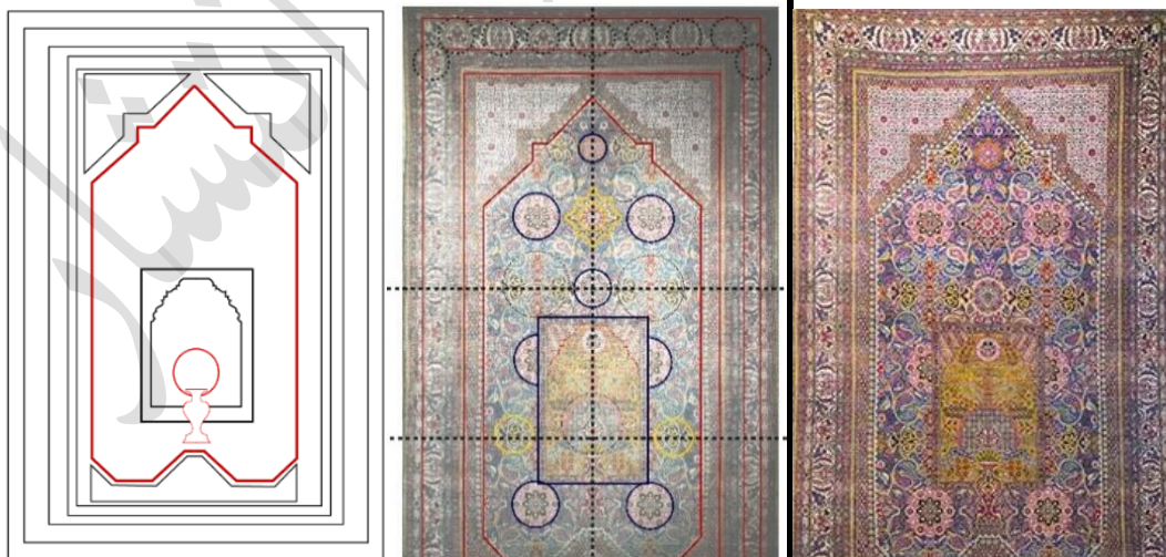
تصویر ۳ سمت راست: نمای قالی تهران دوره قاجار در موزه فرش ایران (نگارندگان، ۱۴۰۳).

نقشه آثار دست بافت ایران، از تنوع بی شماری برخوردار اند به گونه ای که کارشناسان فرش، طرح های موجود ایران را تا ۲۰۰۰ نوع تخمین می زنند؛ که برخی از این طرح ها تغییر یافته و یا زیرمجموعه طرح اصلی هستند. بر اساس تقسیم بندی شرکت فرش ایران، نقشه های فرش به ۱۹ گروه اصلی و تعداد زیادی طرح های فرعی تقسیم می شوند. ۹ این دست بافته که با ابعاد ۳۵۰ در ۲۰۰ سانتی متر، در دسته بندی «قالی ها» می گنجد، متعلق به ربع اول قرن ۱۴ ه.ق یعنی دوره قاجار و بافته شده در شهر تهران می باشد. این اثر از شرکت سهامی فرش ایران به موزه فرش ایران منتقل شده و اکنون با شماره ۱۴۵۶ در موزه محفوظ است. قالی دارای ۴۰ گره نامتقارن یا فارسی باف است. تار، پود و پرز این قالی به ترتیب از جنس نخ، پشم بوده و در گروه فرش های پشمی، جای دارد. طرح قالی مذکور، محرابی گلدانی و رنگ زمینه آن فیروزه ای با حاشیه کرم است (تصویر ۳).