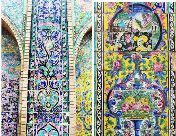
تصاویر ۶ و ۷: کاشی های محوطه کاخ گلستان (نگارندگان، ۱۴۰۳).

بخش زیادی از کاشی های محوطه کاخ گلستان، مزین به همین گونه کاشی کاری است. کاشی ها که به نحوی آشکار با سبک کلی معماری بنا همخوانی دارند؛ علاوه بر جنبه های حفاظتی در جهت افزایش استحکام بنا، دارای جنبه های زیبایی شناسی به ویژه در نقوش طرح هایشان نیز هستند (تصاویر شماره ۶ و ۷).