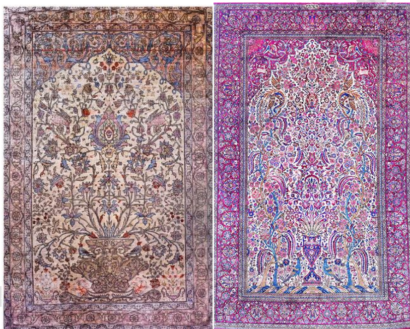
تصویر ۱ سمت راست: قالی با نقشه محرابی (محرابی درختی)، محفوظ در موزه فرش ایران با شماره موزه ای ۵۹ (نگارندگان، ۱۴۰۳).

طرح های محرابی به چند گروه قابل تقسیم هستند، یک گروه که اساس شکل گیری طرح های محرابی در قالی بوده و به طرح های سجاده ای نیز شهرت دارند و در واقع نقوشی چون طاق محراب، قندیل و ستون را که تداعی گر محراب مساجد هستند، در بر می گیرند. ۵ همچنین، ذکر نام فرش های محرابی یادآور محراب، جایگاه نماز، سجده گاه و عبادتی مقدس است. ۶ هنرمند قاجار، به قصد نمایش فضایی آکنده از گل ها و درختان، به رسم اوصافی که از بهشت رضوان در خاطر داشته، پرداخته و با بافت طرح هایی محرابی با یک یا دو درخت (گاه رویش درخت از یک گلدان منشأ گرفته) مقصود خود را به نحوی نمایش داده است. ۷ فرم محراب در طرح قالی ها، اقسام زیادی داشته و از تنوع فرمی برخوردار اند. فرم های طرح های محرابی از نظر انواع ترکیب با سایر طرح های قالیبافی نیز گسترده هستند، از جمله: نقشه های محرابی گلدانی (تصویر ۱).