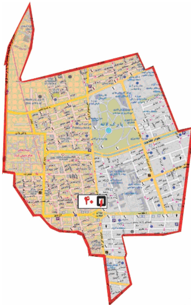
شکل ۳. محدوده‌ی تحت پوشش ایستگاه ۴۰ سازمان آتش نشانی و خدمات ایمنی شهر تهران (www.۱۲۵.ir)