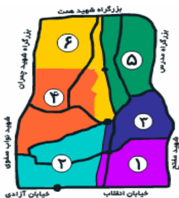
شکل ۱. نمای منطقه ۶ تهران در نقشه مناطق شهر تهران (مجموعه گزارش های آماری منطقه ۶)

ترافیک این محدوده حاصل نشده است. در شکل ۱ نمای مرزهای منطقه ۶ شهر تهران و نواحی درون آن نمایانده شده است.