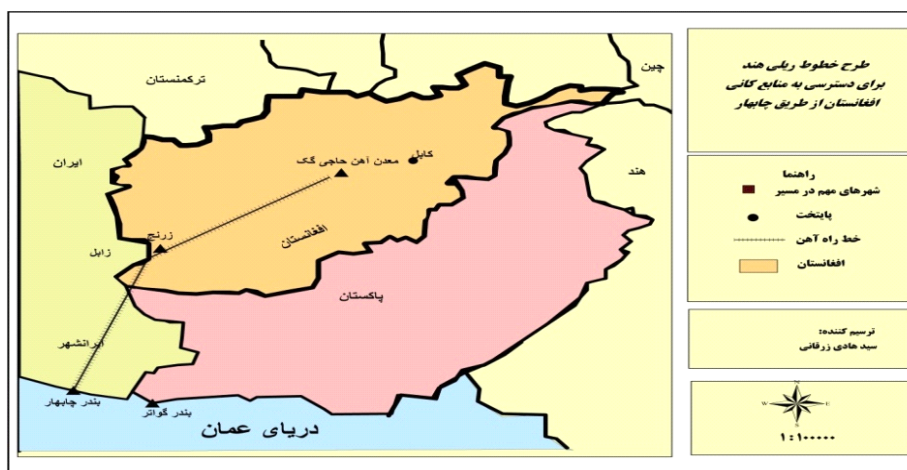
نقشه ۲. پروژه خطوط ریلی برای دسترسی هند به منابع کانی افغانستان از مسیر ایران