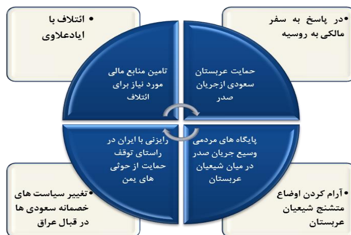
شکل (۲): تحلیل دلایل سفر مقتدی صدر به عربستان سعودی و دیدار با محمد بن سلمان

درخواست سعودی‌ها از صدر برای رایزنی با جمهوری اسلامی ایران برای توقف حمایت از حوثی‌ها در جنگ یمن باشد (Mostafa, 2017, pp.3-4).