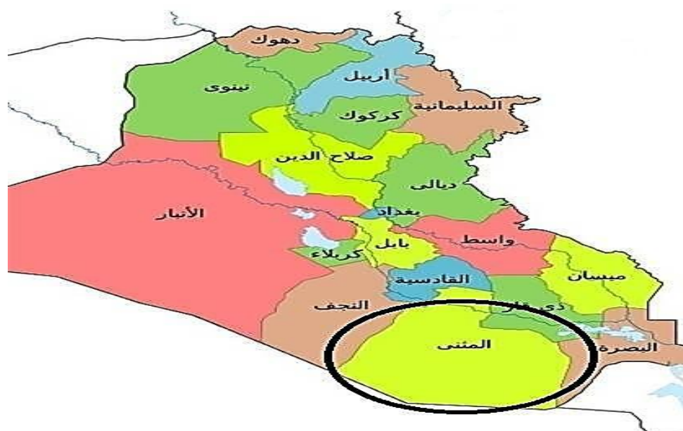
نقشه ۱: جایگاه ژئواستراتژیک استان المثنی برای سرمایه‌گذاری سعودی‌ها در طرح‌های توسعه‌ای جریان صدر