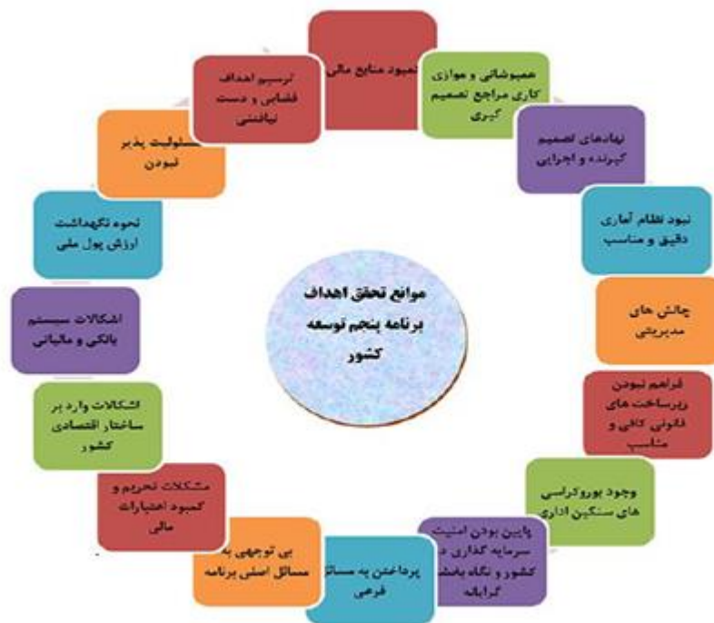
شکل ۲- موانع تحقق اهداف برنامه پنجم توسعه ایران

در برنامه پنجم توسعه برخلاف اعداد گزارش شده هیچ اقدامی در جهت افزایش سهم تعاونی‌ها در برنامه‌ریزی بلندمدت و بودجه سالانه صورت نگرفت و با آن وضع نتوانستند به اهداف مورد نظر دست یابند. با توجه به آن که اقتصاد مقاومتی به‌معنای حضور مردم در اقتصاد است و بهترین و والاترین اقتصاد مردمی، تعاونی است، برای پررنگ شدن