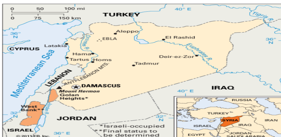
نقشه ۱. موقعیت جغرافیایی سوریه

محوری این کشور در اکثر بحران‌های منطقه‌ای مانند جنگ ایران و عراق، صلح خاورمیانه، حمله عراق به کویت و ...، گواهی بر اهمیت استراتژیک و ژئوپلیتیک این کشور در خاورمیانه است. اهمیت و نقش سوریه در معادلات خاورمیانه تا اندازه‌ای است که هنری کسینجر می‌گوید: «اعراب نمی‌توانند بدون مصر بجنگند و بدون سوریه صلح کنند» (Ahmadi Arkami & Nami, 2019: 21). همچنین سوریه یک بازیگر ژئوپلیتیک محور است که با سه عامل واقع شدن در منطقه استراتژیک خاورمیانه، قرار گرفتن بر کناره شرقی دریای مهم مدیترانه و برخورداری از ۱۸۶ کیلومتر ساحل با کشورهای حاشیه این منطقه ارتباط دارد. نقش آفرینی سوریه در معادلات سیاسی لبنان و قرار گرفتن دمشق به عنوان دولت حامی مقاومت اسلامی، بر اهمیت استراتژیک سوریه افزوده است (Ghasemi Aliabadi & others, 2018: 68-69). از این رو، به دلیل اهمیت و نقش راهبردی این کشور، بسیاری از کارشناسان روابط بین‌الملل، «سوریه را بزرگ‌ترین کشور کوچک جهان» لقب داده‌اند (William Samii, 2008: 42). سوریه کشوری بسیار مهم از لحاظ جغرافیایی و استراتژیک است. از نظر موقعیت جغرافیایی، سرپل سه قاره آفریقا، اروپا و آسیا محسوب می‌شود. ۱۸۵ هزار کیلومتر مساحت و ۱۸۰ کیلومتر مرز آبی با مدیترانه باعث شده تا دسترسی به اروپا و شمال آفریقا برای این کشور به‌آسانی فراهم گردد. از حیث جغرافیای سیاسی نیز ۷۰ کیلومتر مرز مشترک با رژیم صهیونیستی و ۳۵۰ کیلومتر مرز مشترک با لبنان باعث شده تا این کشور موقعیت متمیزی در این منطقه داشته باشد (Esmailpour Roshan, 2017: 232).