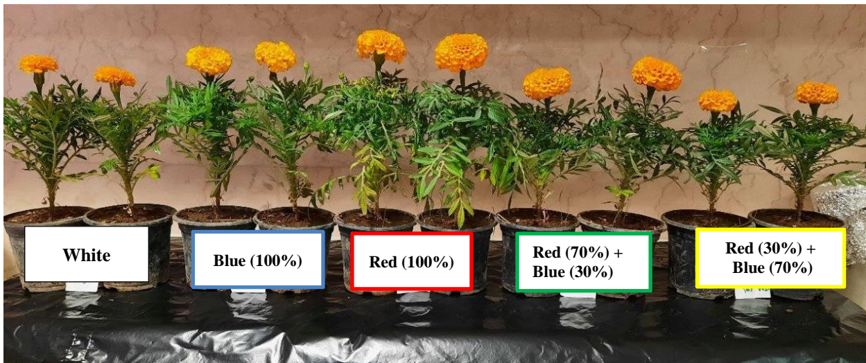
شکل ۴. تاثیر کیفیت‌های مختلف نور LED بر Tagetes erecta Antigua orange Fig 4. Effect of LED light quality on Tagetes erecta Antigua orange