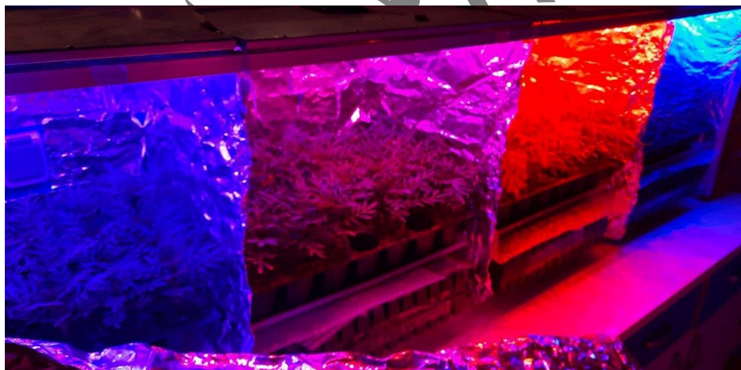
شکل ۱. تیمارهای مختلف نور LED در پژوهش

در این پژوهش تنها از لامپ LED ساخت شرکت Chanzon در کیفیت‌های مختلف به عنوان منبع نوری جهت رشد گیاه استفاده گردید. تیمارها در هر دو آزمایش شامل نور سفید (۱۰۰٪)، نور آبی (۱۰۰٪)، نور قرمز (۱۰۰٪)، نور آبی + ۷۰٪ نور قرمز و ۷۰٪ نور آبی + ۳۰٪ نور قرمز حاصل از لامپ LED بود. میزان شار فوتون فتوسنتزی در تمام تیمارها معادل ۱۰۰ میکرومول بر متر مربع بر ثانیه حفظ شد. در این آزمایش از دیودهای نور قرمز با طول موج در محدوده ۶۲۰ تا ۶۲۵ نانومتر، توان ۱ وات و ولتاژ ۲/۲ و طول موج نور آبی در محدوده ۴۶۰ تا ۴۷۰ نانومتر، توان ۱ وات و ولتاژ ۳/۲ استفاده گردید.