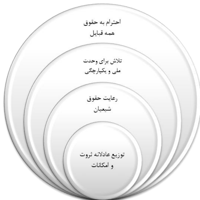
شکل (۳): سطح بندی عوامل مؤثر بر وحدت قومیتی

قدرت نفوذ و میزان وابستگی هر کدام از عوامل در نمودار شماره ۴ ارائه شده است.