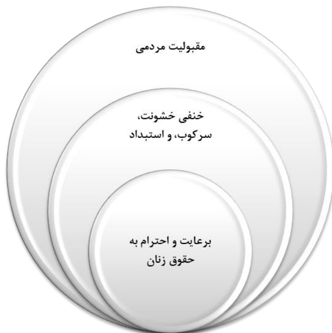
شکل (۴): سطح بندی عوامل مؤثر تقویت پایگاه اجتماعی (مشروعیت)