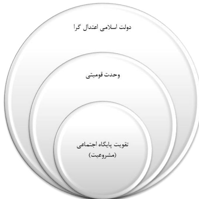
شکل (۱): سطح بندی عوامل اصلی مؤثر بر روند دولت سازی دوم طالبان در افغانستان

گام پنجم: در این مرحله با توجه به سطوح عوامل و ماتریس دست یابی نهایی مدل ساختاری - تفسیری عوامل اصلی مؤثر بر روند دولت سازی دوم طالبان در افغانستان در شکل شماره ۱ ترسیم گردیده است.